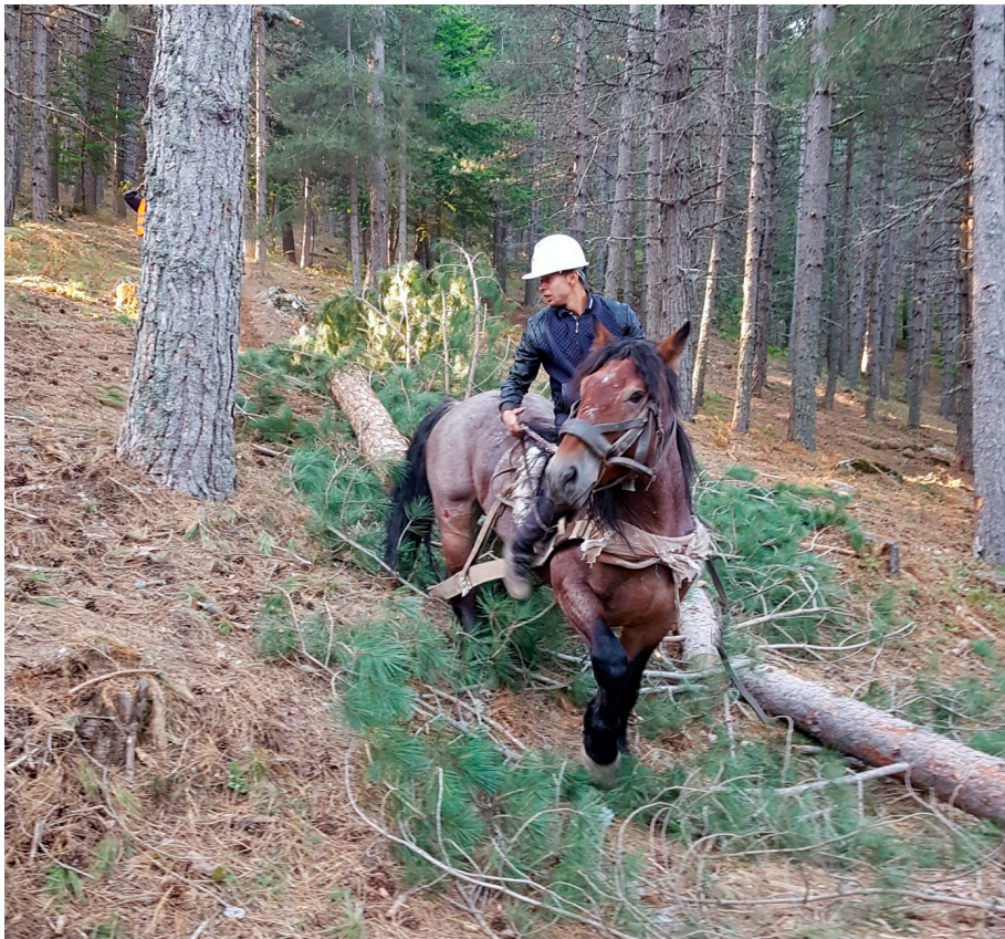
En naturlig "skotare" i Kalabrien i södra Italien.

Vi var representanter från 14 länder när vi den 27:e till 30:e september möttes i Camigliatello Silano i Kalabrien i södra Italien. Vård för detta det 21:a Governing Council Meeting var CONAF (Consiglio dell'Ordine Nazionale dei Dottori Agronomi e dei Dottori Forestali). Lite kort kan nämnas att CONAF samlar både agronomer och skogliga tjänstemän inom samma organisation i Italien.