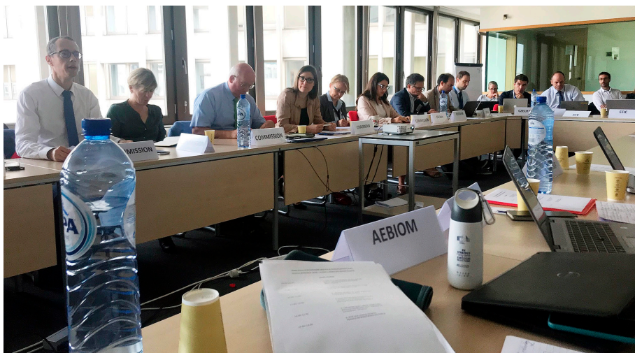
Expert group on forestbased industry sammanträder kring EUs fiberanvändning.

Vår skogsbruksmodell är gångbar ett tag till. En stor del av framgången i detta är bra svensk närvaro i debatten på plats i Bryssel. Där finns LRF-skogsägarna på plats genom sin europeiska samlingsorganisation, Sveaskog genom statsskogarnas samverkan och SSF genom vår tjänstemannaorganisation UEF. Utöver detta är det en handfull grupp skogsintresserade parlamentariker från de nordiska länderna som stretar på för skogens brukande. Plockar man bort dessa