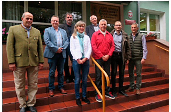
Senaste UEF styrelsemötet i Polen september 2020

Vi, tillsammans med alla skogstjänstemän inom Europa, gör den bedömningen att skogen behöver ett finansierings-system för dom värden som samhället kräver skogsägaren på, utan att riktigt betala för. I dom nordiska länderna är vi vana avreglering, och styrning genom marknadskrafter. En reglering och finansiering likt EU's jordbruksstöd för skog känns långt borta.