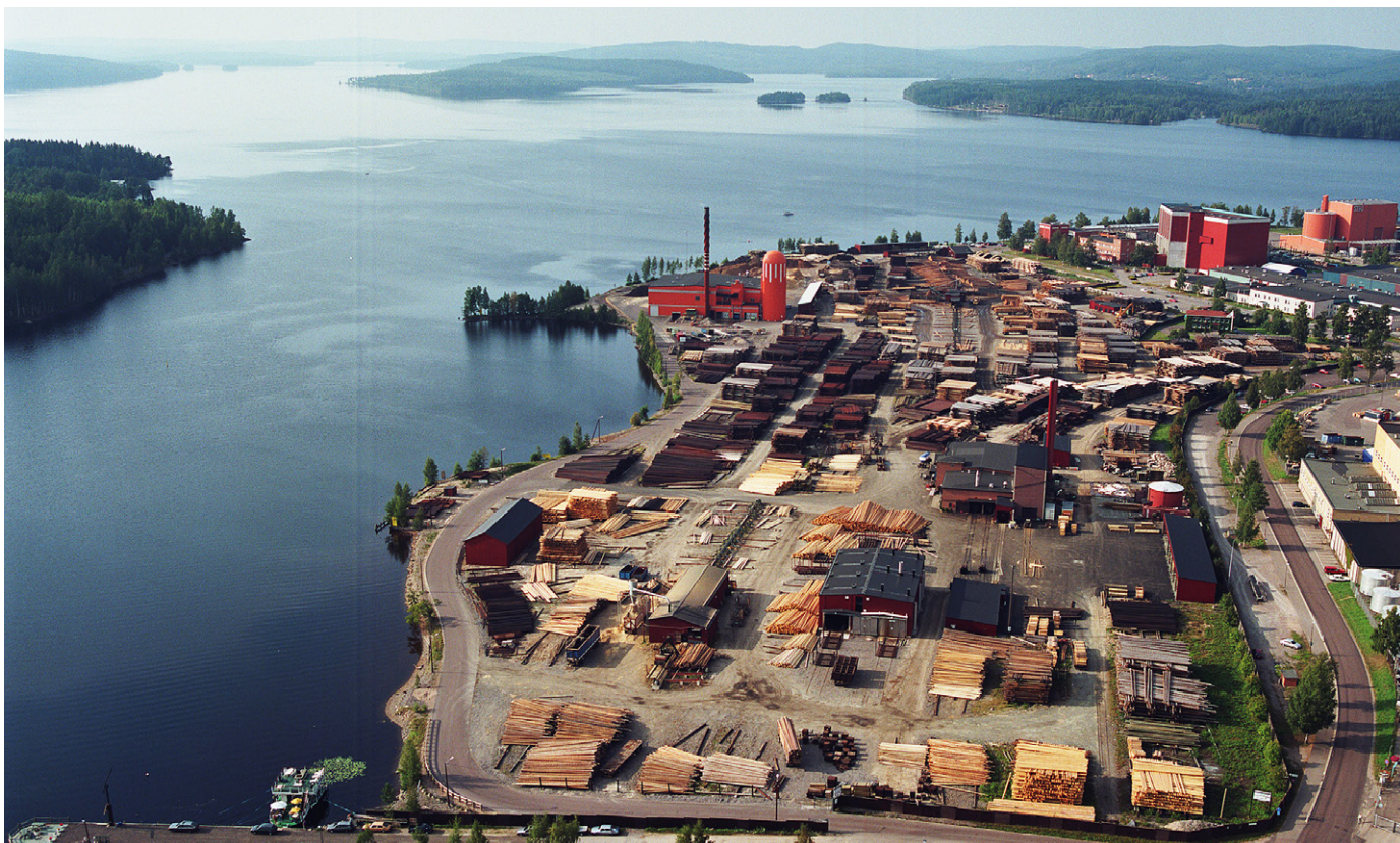
Rundvirke Skog fabriks i Ludvika som producerar närmare 50 000 trub.stolp och slippers.

Ja! i dessa tider kan det vara på sin plats med lite positiva tongångar när det mesta annars handlar om Covid-19 och om det knasiga som händer i USA m.m.