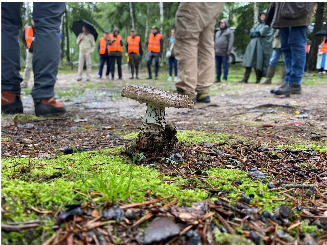
Färna Ekopark på morgonen.

Biologisk mångfald i produktions-skog var huvudämnet för två fullspäckade dagar när UEF samlades i Färna, Bergslagen.