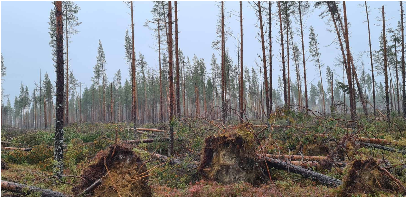
Stormen Hans, eller Hasse som den kallas av skogsfolk i Västerbotten.