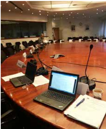
”Runda bordet” i Bryssel.

Först timmerförordningen och artskyddsförordningen, sen LULUCF och talloljan. Parallellt kör Skogsstyrelsen en översyn av skogsvårdslagen med idéer om ökad nyckelbiotopsinventering och införande av allmän talerätt vid slutavverkning.